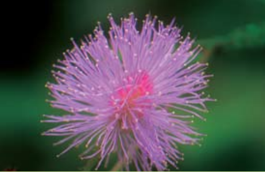
Mimosa (Mimosa pudica)